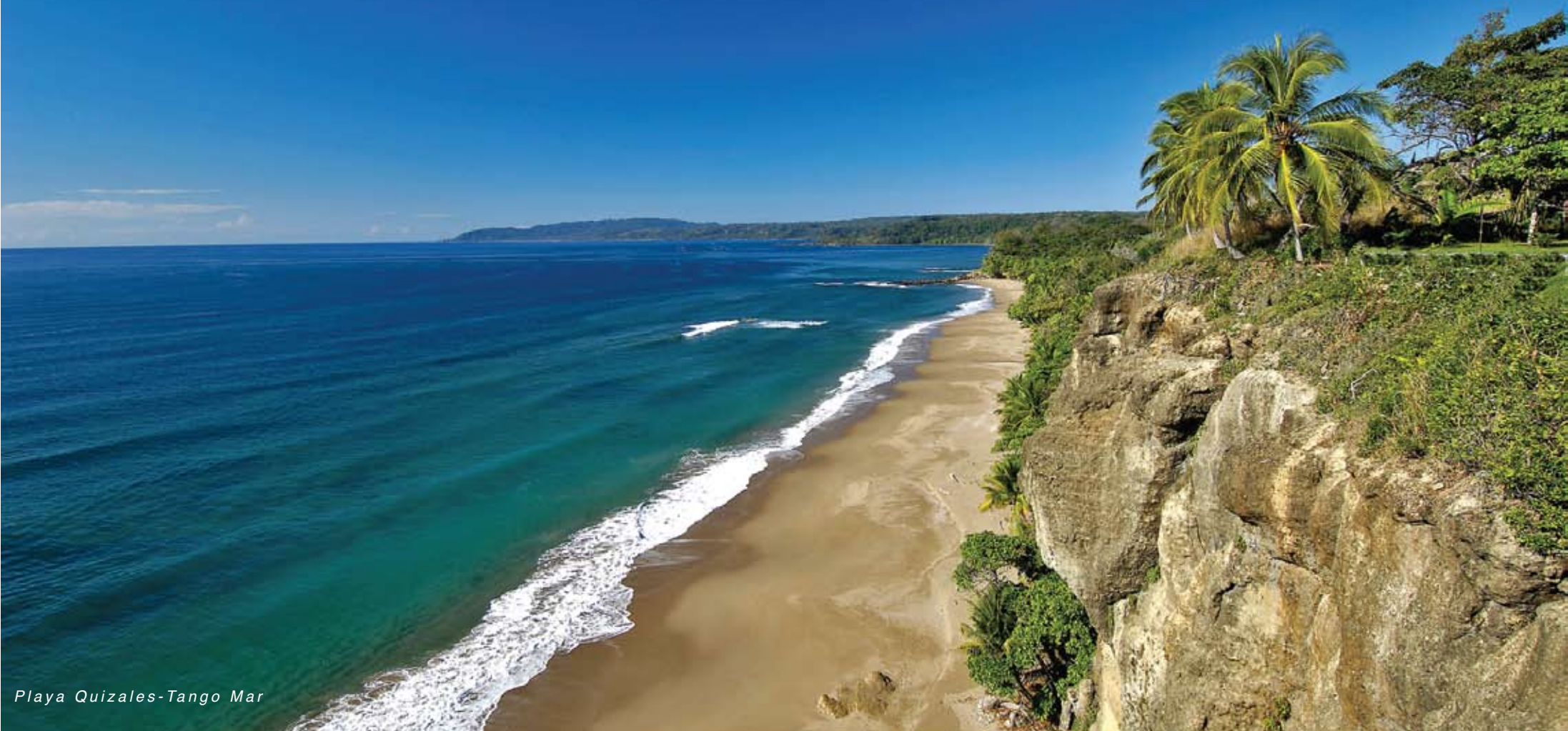
Playa Quizales-Tango Mar

Adventure Leisure Culture Business Family Honeymoon Ecotourism Incentives Luxury Travel Spa